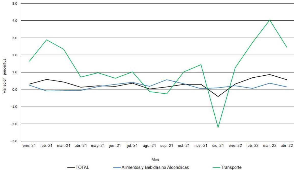
CUADRO 2. EVOLUCIÓN DE LA VARIACIÓN DEL ÍNDICE DE PRECIOS AL CONSUMIDOR NACIONAL URBANO, SEGÚN GRUPO DE ARTÍCULOS Y SERVICIOS: DE ENERO A ABRIL DE 2022