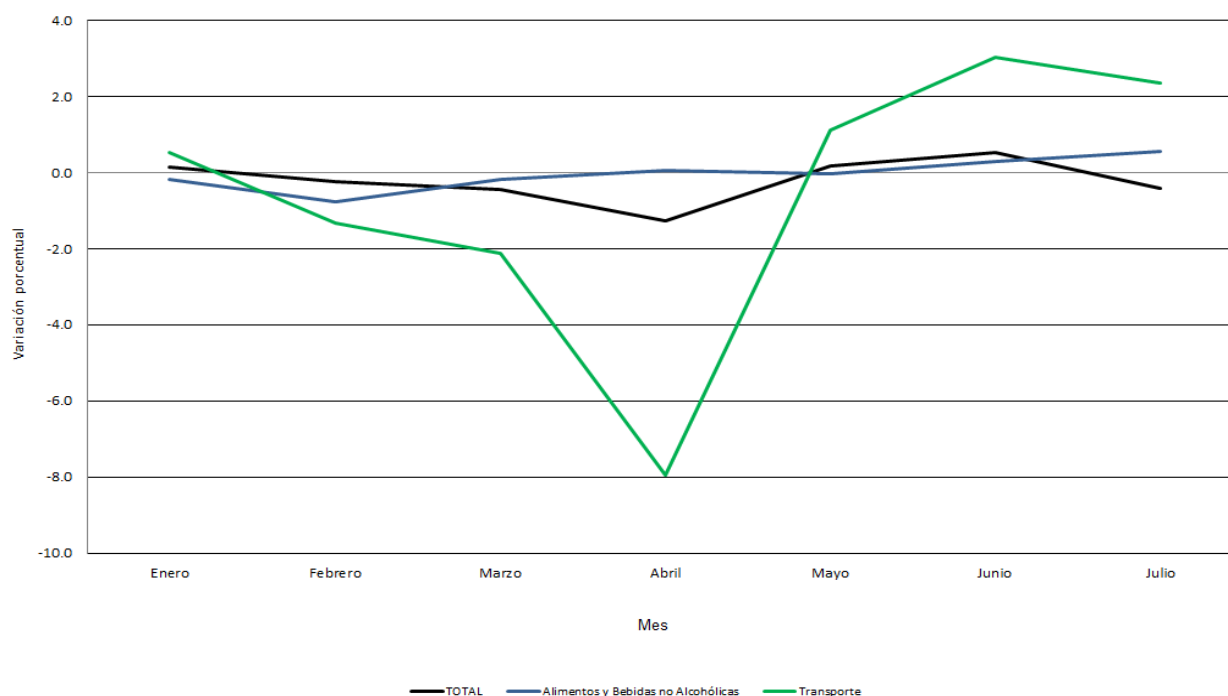
CUADRO 2. EVOLUCIÓN DEL ÍNDICE DE PRECIOS AL CONSUMIDOR NACIONAL URBANO, SEGÚN GRUPO DE ARTÍCULOS Y SERVICIOS: ENERO-JULIO DE 2020