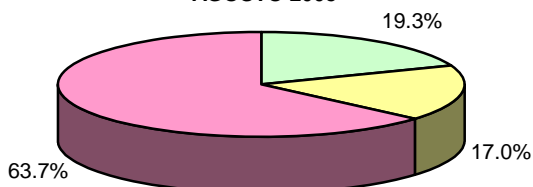
POBLACIÓN OCUPADA POR SECTORES EN LA ACTIVIDAD ECONÓMICA: ENCUESTA DE HOGARES AGOSTO 2005

■ Sector Primario ■ Sector Secundario ■ Sector Terciario